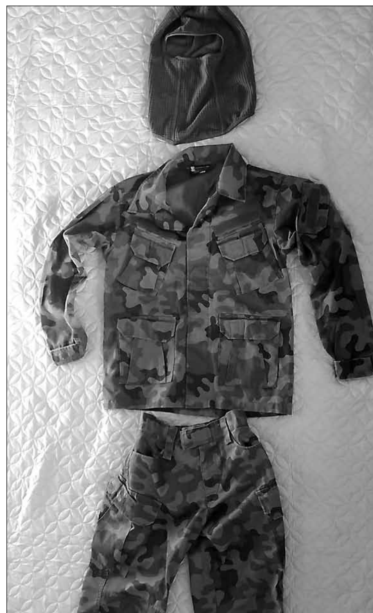
Fot. Radosław Chłowiak